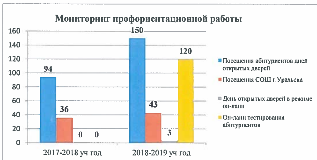
Рисунок 2. Мониторинг профориентационной работы в разрезе 3-х лет