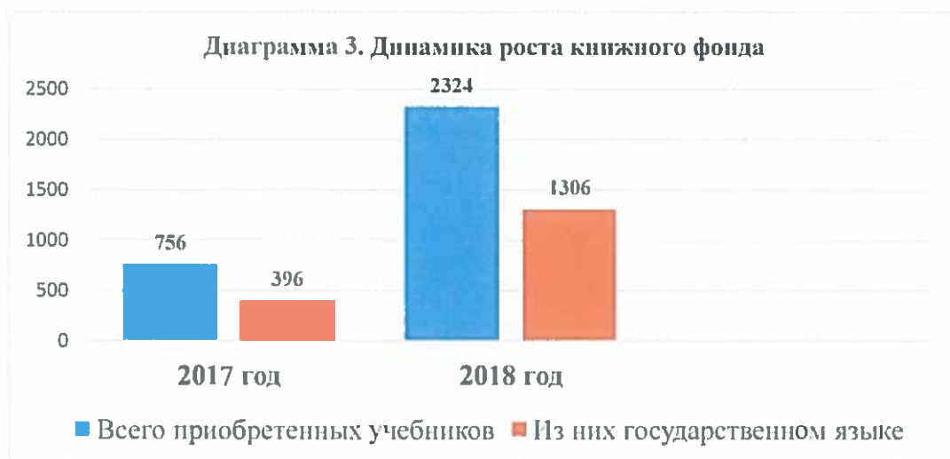
Рисунок 3. Сравнительный анализ обеспечения учебной литературой

Информационная система «Параграф» и электронная библиотека «Консультант студента» с 10 точками доступа к e-library продлены договора с ЗКГМУ им.М.Оспанова до конца 2020 года.