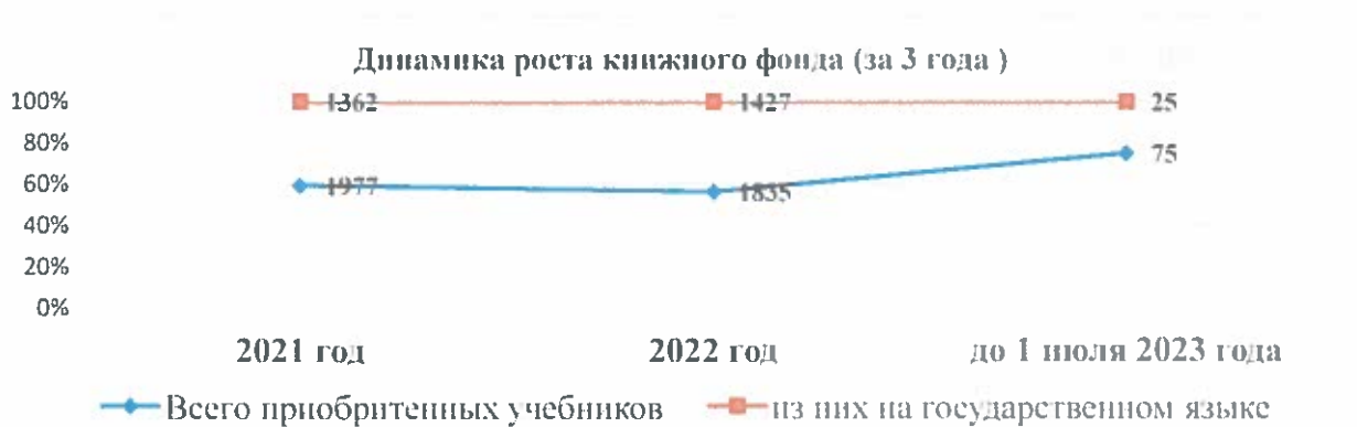
Рисунок 3. Сравнительный анализ обеспечения учебной литературой

В рамках Операционного плана мероприятий по взаимодействию между Акиматом ЗКО и НАО "КазНМУ им. С.Д.Асфендиярова", действующего на основании Меморандума о сотрудничестве, с января 2022 года колледжу обеспечен доступ в электронные базы данных Web of Science ( www.webofscience.com ), национальным электронным библиотекам Aknurpress ( www.aknurpress.kz ) и Эпиграф ( www.elib.kz ).