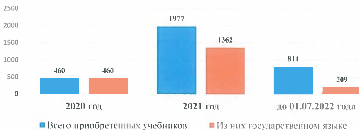
Диаграмма 3. Динамика роста книжного фонда

С 2017 до 2022 года ЗКВМК на основе подписанного меморандума с ЗКГМУ им. М. Оспанова использовал 10 точек доступа к электронным библиотекам: «Консультант студента» ( www.studmedlib.ru )- 3 точки доступа, «Консультант врача» ( Ошибка! Недопустимый объект гиперссылки. точки доступа и «Медицинские книги» ( www.books-up.ru ) – 5 точек. В электронном зале создана база данных электронных книг по дисциплинам. ( elbookzkvmk@gmail.com ). Электронный доступ к библиотеке во время ДОТ обеспечивалась через платформу www.college.snation.kz . где в разделе «Библиотека» была загружена вся учебная литература по предметам, учебно-методические комплексы по дисциплинам (ЦОР). В рамках Операционного плана мероприятий по взаимодействию между Акиматом ЗКО и НАО "КазНМУ им. С.Д.Асфендиярова", действующего на основании Меморандума о сотрудничестве, с января 2022 года колледжу обеспечен доступ в электронные базы данных Web of Science ( www.webofscience.com ),