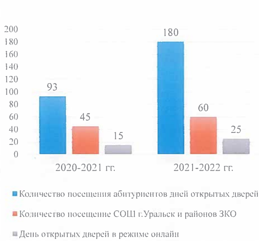
Мониторинг профориентационной работы в разрезе 2-х лет